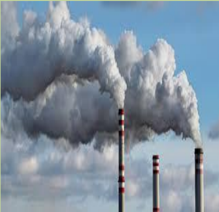
DIM IZ TOVARNIŠKI DIMNIKOV